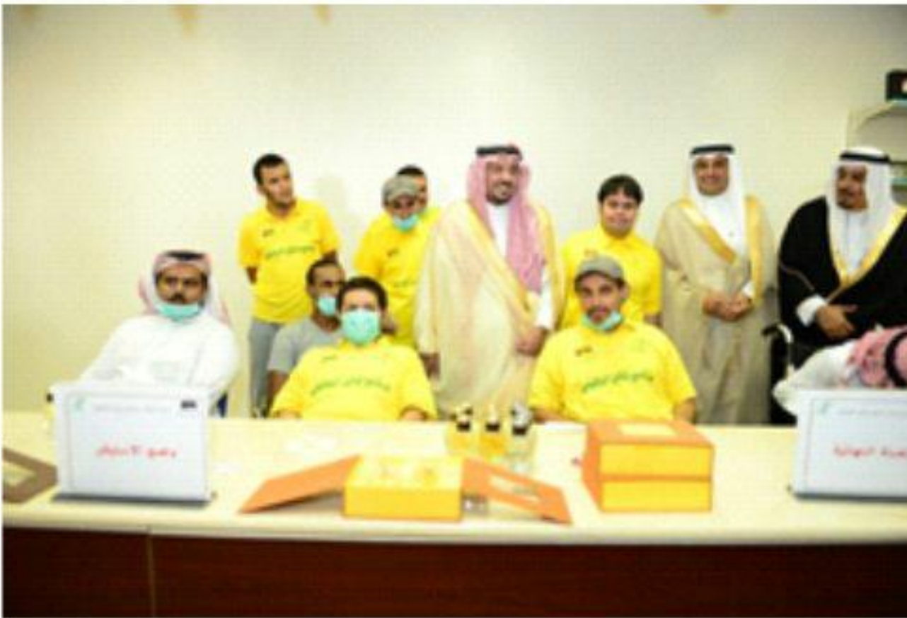
سموه الكريم يتفقد الطلاب في الفصول