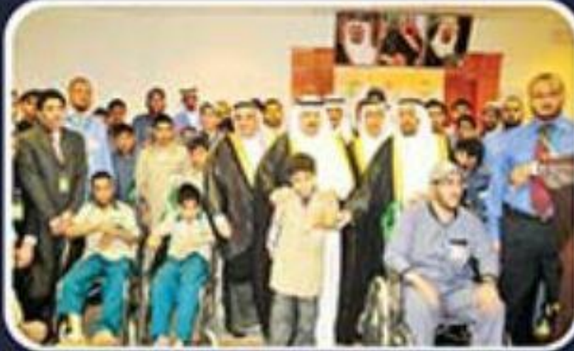
تحت شعار التغيير برؤية عصرية جمعية عزيرة ترحب برعاية فيصل القصيم وعقد مؤتمر خبراء الإعاقة والتأهيل الأول (تأهيل)