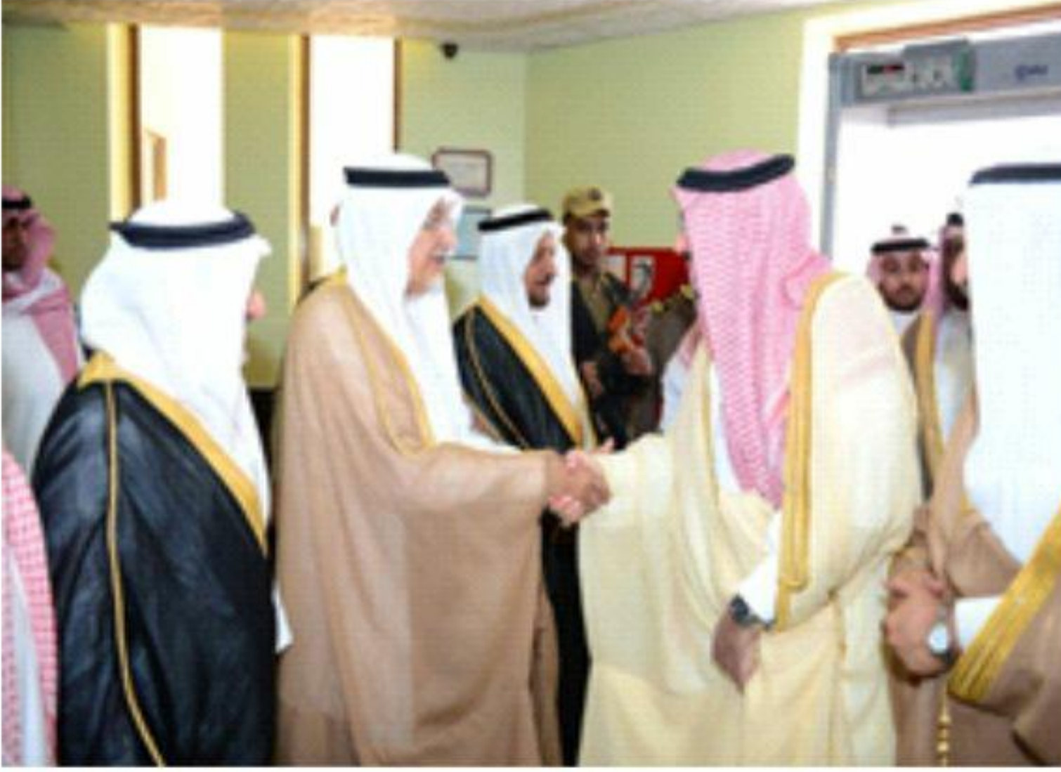
اعضاء مجلس ادارة الجمعية باستقبال سموه الكريم ب مقر مجمع الجفالي للرعاية و التأهيل