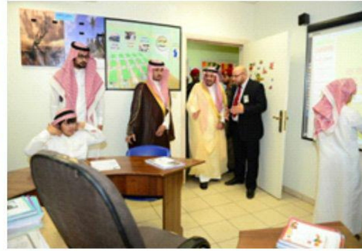
سموه الكريم يتفقد الطلاب في الفصول