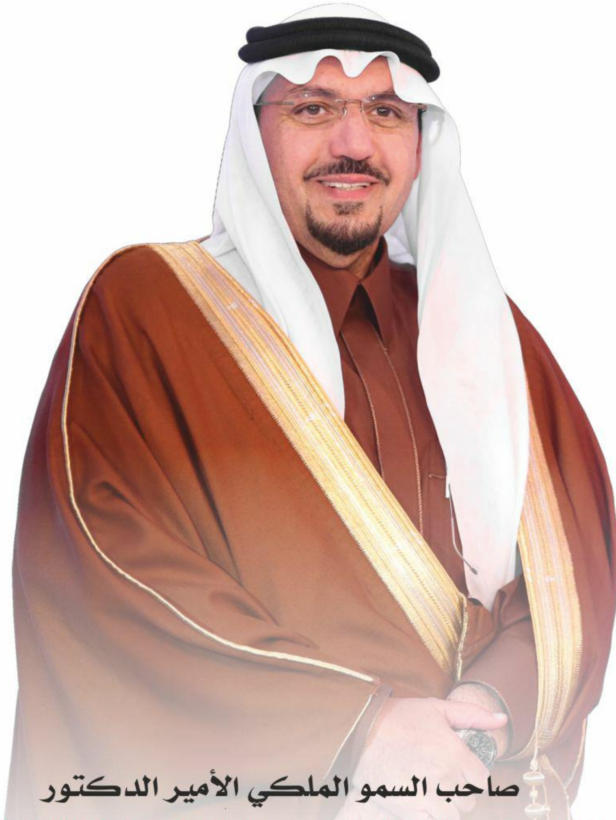
صاحب السمو الملكي الأمير الدكتور

فِيصَلِّكَ مِنْ شِعْرِكَ سُبْحَانَكَ يَا عَزِيزًا