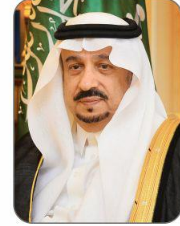
صاحب السمو الملكي الأمير فيصل بن بندر بن عبد العزيز آل سعود الرئيس الفخري للجمعية