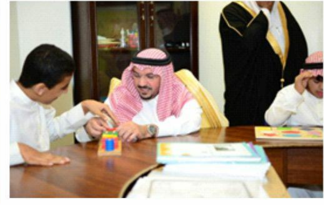
سموه يشارك احد ابناء المجمع في اللعب و التعلم