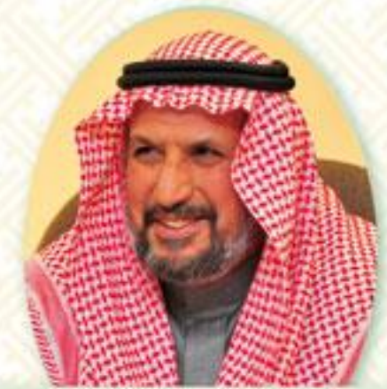
عبد الله اليحيى السليم محافظ عنيزة السابق لواء ركن طيار - متقاعد